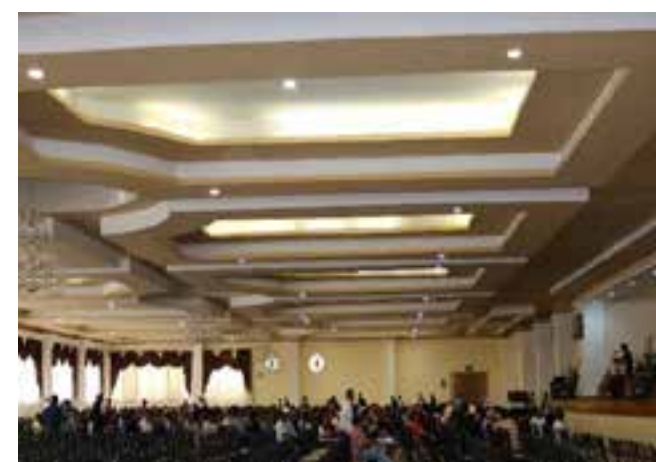
Congreso de Área Zacatecas (24 de agosto de 2016).

Aunque se trata de una de las áreas más jóvenes dentro de la estructura, se puede comprobar que, en menos de 20 años de vida, Zacatecas Oriente ha dado prueba de cómo la unidad logra resultados