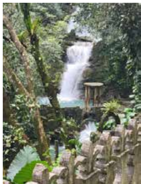
Las Pozas, en Xilitla, San Luis Potosí.

mensaje a otras partes de la zona sur de la Huasteca Potosina: Xilitla, Axtla y Matlapa. Junto con el grupo «Vive y Deja Vivir», estos dos pioneros fueron transmitiendo el mensaje a varias partes del estado. La década de 1980 fue crucial para el Área, pues con el paso del tiempo el ingreso de miembros fue en aumento, hasta el punto en que esta parte del estado estuvo lista para conformar su propia área.