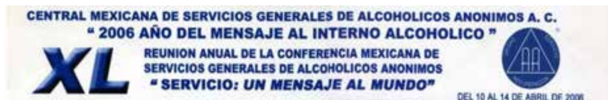
Imagen alusiva de la XL Reunión Anual de la Conferencia Mexicana (2006).

Los AA solicitantes de la apertura de una nueva área eran militantes de grupos y distritos ubicados en los municipios de Salinas de Hidalgo, Loreto, Noria de Ángeles, Pánfilo Natera, Pinos, Villa Hidalgo y Villa González Ortega, todos estos en el estado de Zacatecas y que estaban adheridos a las áreas aledañas: unos a San Luis Potosí Uno, otros a Aguascalientes y otros a Zacatecas Sur.