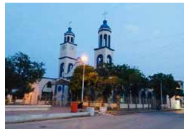
Parroquia Sagrado Corazón de Jesús, en Ébano.