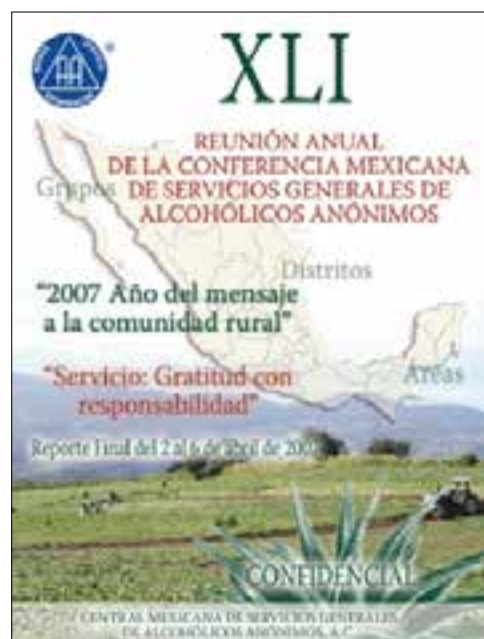
Reporte final de la XLI Reunión Anual de la Conferencia Mexicana.

El Área inició con once distritos. Ahora, solo se cuenta con ocho distritos activos que albergan a 48 grupos tradicionales, sumando un total de 250 miembros de AA y