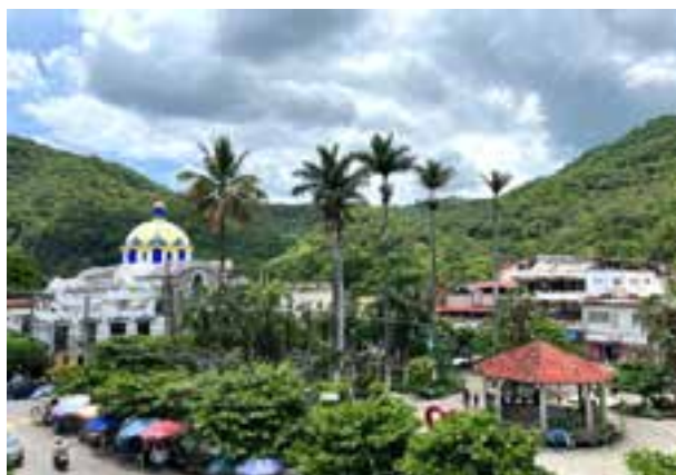
Centro de Tamazunchale.

El 15 de octubre de 1980 se creó el grupo «Acción», en Tamazunchale, considerado otro de los grupos más importantes en el Área San Luis Potosí Dos. De este grupo salieron compañeros entusiastas que llevaron el