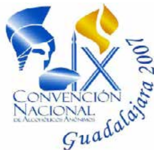
Cartel oficial de la IX Convención Nacional de Guadalajara (2007).

El año de 2007 fue de un intenso movimiento para la estructura mexicana, con la celebración de la IX Convención Nacional, celebrada del 23 al 25 de marzo, en Guadalajara, Jalisco (la primera en su historia). Posteriormente, llegada la Semana Santa, del 2 al 6 de abril iniciaron los trabajos de la XLI Reunión Anual de la Conferencia Mexicana de AA, dentro de los cuales se atendieron diversos puntos,