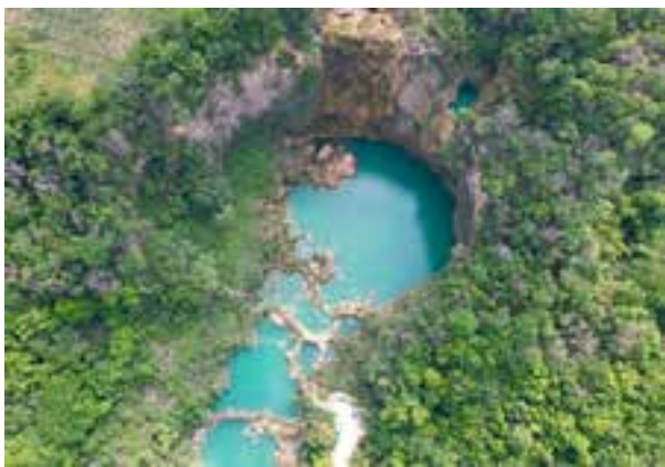
Cascada El Salto, en El Naranjo.

ferentes momentos, pero en la misma década.