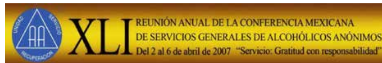
Imagen alusiva a la XLI Reunión Anual de la Conferencia Mexicana (2007).

respectiva recomendación al pleno y el día 5 de abril de 2007, durante los trabajos de la 41. a Reunión Anual de la Conferencia Mexicana de Servicios Generales de Alcohólicos Anónimos, esta pasó como sugerencia, naciendo el Área número 80 con el nombre de Área Zacatecas Oriente, ubicándose dentro de la Región Norte Oriente. Es necesario mencionar que esta solicitud se hizo llegar al Comité de Política y Admisiones de Conferencia y, tal como debe ser, no como una «solicitud», sino como lo sugiere El Manual de Servicio : llegar como una «inquietud».