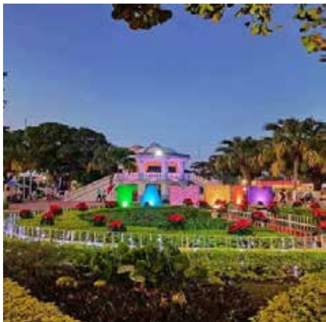
Centro de Tamuín.