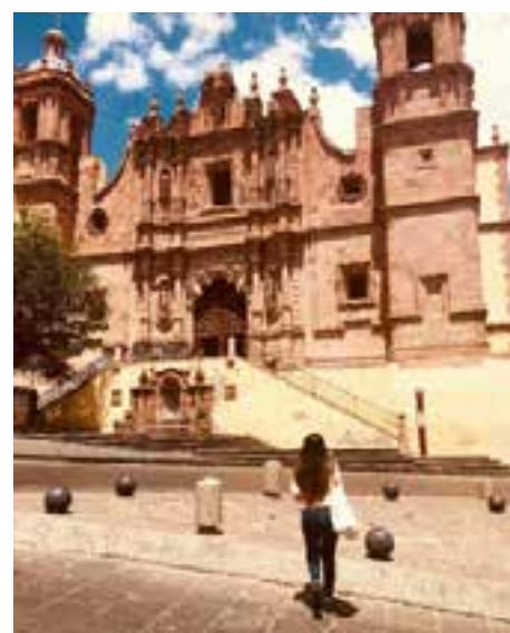
Ciudad de Zacatecas.

un grupo institucional ubicado en el Centro de Reinserción Social de Pinos, Zacatecas, con una población aproximada de 50 personas privadas de su libertad consideradas AA.