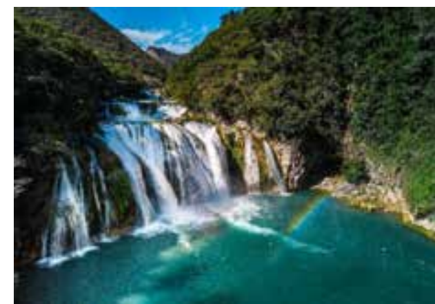
Cascada El Toro, Ciudad Valles.

Los primeros grupos de esta Área se fueron fundando de una manera no muy uniforme; los municipios correspondientes a cada uno de sus distritos recibieron el mensaje en di-